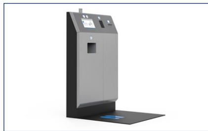
Terminalversion mit Drucker